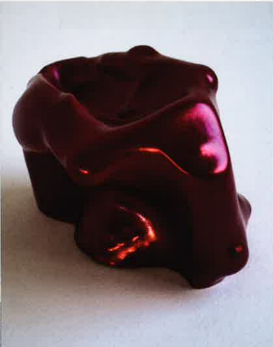
Marie-Josée Comello, You seem familiar , 2016; porselein, autolak, gegoten en handgevormd; h. 15 x 11 x 10 cm.