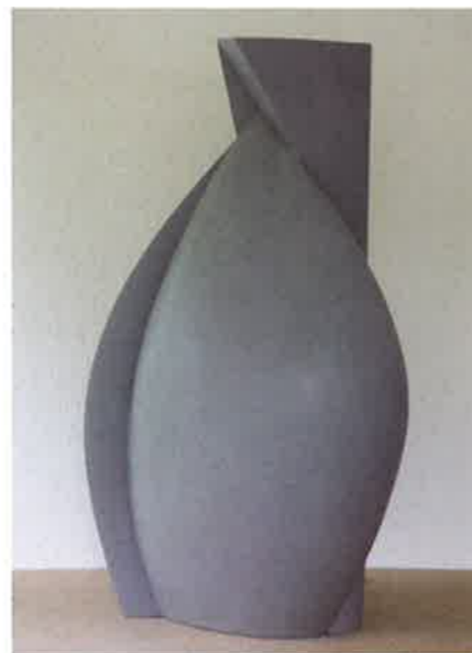
Karel Sterk, Z.T. (Vaassculptuur), 2015; steengoed; h. 70 x 38 x 26 cm

“Wanneer ik een nieuwe sculptuur of vaassculptuur maak, zijn de vormcontrasten van hoekig/rond, scherp/zacht altijd het uitgangspunt. Deze vormcontrasten zijn voor mij een onuitputtelijke bron van inspiratie en daardoor een steeds terugkerend thema in mijn werk. De harde, scherpe lijnen in contrast met zachte, vloeiende zoals je dat in de natuur aantreft. In sneeuwduinen na een stormachtige wind en zandduinen aan de kust of in de woestijn. Ik vind het steeds weer