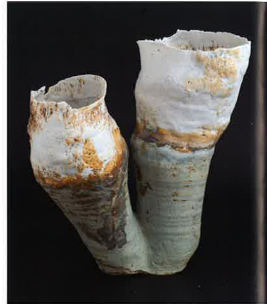
Wietske Hellinga, Schelpvaas Koraal , 2015; porselein en Franse grès, symmetrische basisvorm gedraaid, daarna vervormd en met de hand het porselein gemonteerd; h. 35 x 18 x 30 cm.

boeiend om deze contrasten, zonder een duidelijk plan, uit te werken tot een harmonieus geheel.”